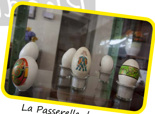
La Passerelle des Arts