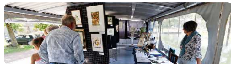
Parcours d'artistes 2018 - Péniche AUCLA

Le dimanche 10/06 de 07h30 à 12h30. Au Centre culturel. Entrée libre. Infos vendeurs 02/387 15 19