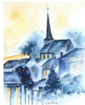
Atelier de céramique Ville-sur-Haine

Durant ces derniers mois, de nombreux citoyens, des représentants d'associations et des experts dans divers domaines se sont joints à notre équipe et à ses instances pour imaginer de quoi sera constitué le futur projet du Centre culturel. Cette démarche collective est reprise sous l'appellation d'« analyse partagée du territoire ». Suite à ces rencontres et échanges venus de tous horizons, nous avons rassemblé de nombreuses idées, interrogations et suggestions, qui ont fait l'objet d'un travail de réflexion et d'articulation. Durant le mois de janvier 2023, vous aurez l'occasion de découvrir la manière ludique et créative par laquelle tous ces avis se sont exprimés. Une exposition se tiendra dans la salle des poètes afin d'illustrer et d'expliquer cette démarche collective de plusieurs mois qui nous projettera dans le futur du Centre culturel.